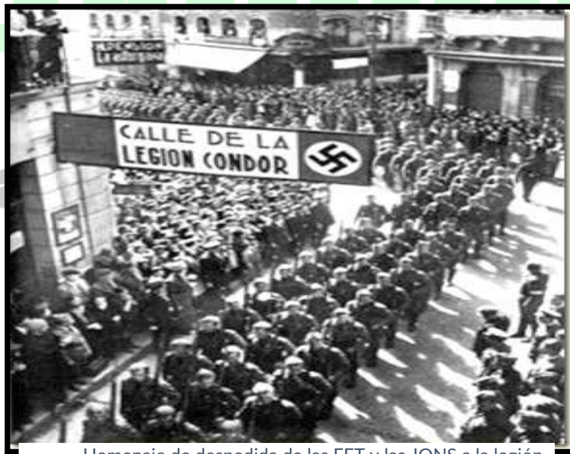
Homenaje de despedida de las FET y las JONS a la legión Cóndor en León (1939)

La internacionalización del conflicto civil español supuso que los dos bandos fueran apoyados por otros países, a pesar del compromiso de los miembros del Comité de No Intervención para evitar el estallido de una nueva guerra europea. Los sublevados contaron con la Alemania nazi y la Italia fascista, recibiendo principalmente aviones, barcos, dinero y soldados; la República recibió la ayuda de la URSS comunista y las Brigadas Internacionales. España pagó a Alemania, Italia y URSS el apoyo militar recibido. La actuación de la Legión Cóndor fue fundamental para la victoria franquista. Bombardeó muchas ciudades republicanas, siendo el bombardeo de Guernica uno de los más conocidas. Para Hitler, la intervención aérea en España supuso un buen ensayo para conocer la capacidad destructiva de su aviación con miras a la segunda guerra mundial que pronto se iba a declarar.